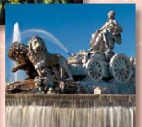
Travel Arrangements by: Catholic Travel Centre of Burbank, California